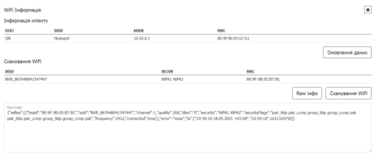
Таблиця 3 - Опис параметрів розділу Wi-Fi Інформація