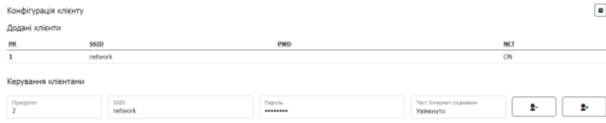
Таблиця 2 - Опис параметрів розділу Конфігурація клієнтами