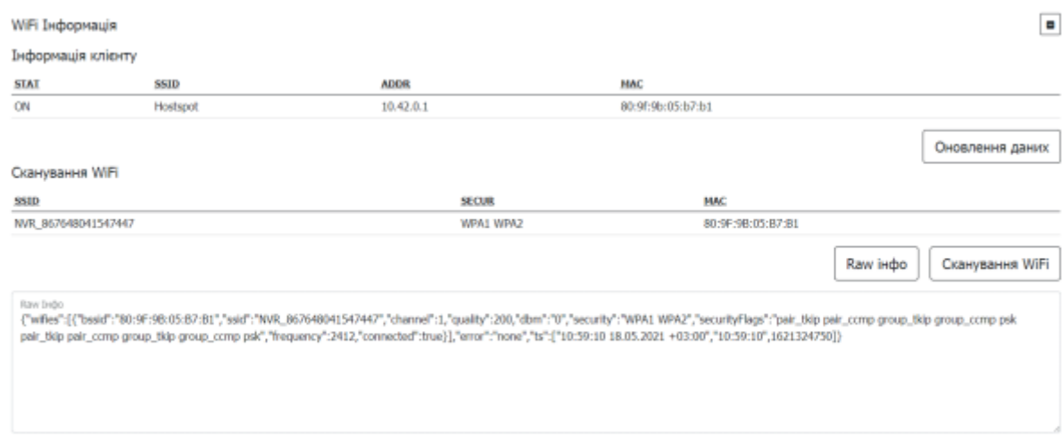
Таблиця 3 - Опис параметрів розділу Wi-Fi Інформація