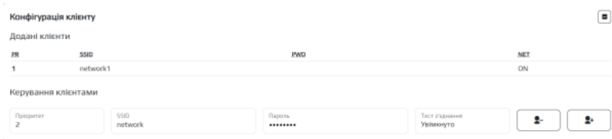
Таблиця 2 - Опис параметрів розділу Конфігурація клієнтами